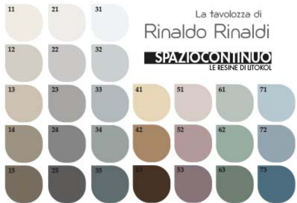
TABLEAU DES COULEURS